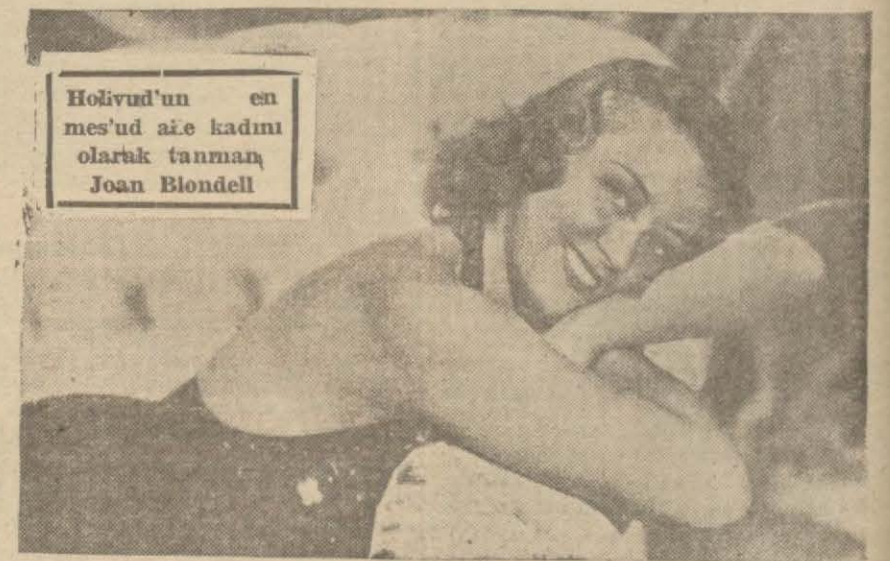
Hollywood'un en mes'ud aile kadını olarak tanınan Joan Blondell

Kadın muhakkak yemek pişirmesini bilmelidir. Birçok erkekler eve karısının pişirdiği yemeklerin nefaseti sayesinde bağlanır. Akıllı bir kadın kocasına hiç bir zaman fazla emniyet etmemelidir. Kocayı iş zamanında havai şeyler için rahatsız etmek doğru değildir. Erkeği hiç bir şekilde tenkid etmemelidir.