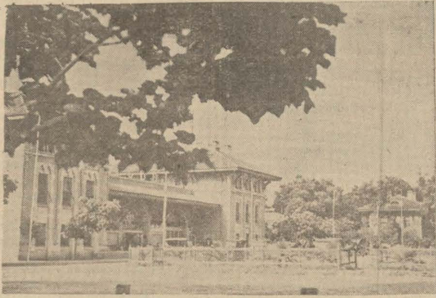
Adana İstasyonundan bir görünüş

Borsada satışa arz edilen malların diğer alıcılardan evvel ofise teklif edilmesi kararlaştırıldı