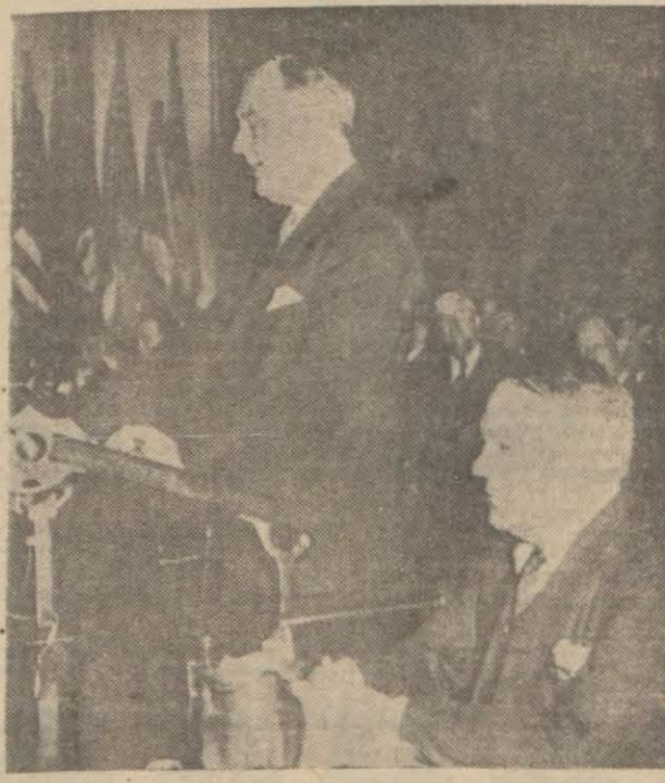
Ruzvelt meşhur nutuklarından birini söylerken