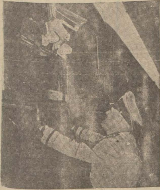
Hitler ile Mussolini bundan evvelki mülakatlarında